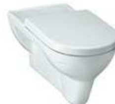
WC Laufen Pro mit Unterspülkasten

Handtuchhalter und WC-Rollenhalter sind von den Käufern zu stellen.