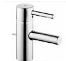
Einhebel-Waschtischmischer Grohe Essence