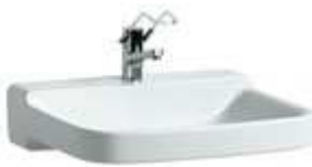
Waschtisch für Bad – Laufen Pro 60x48