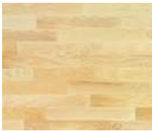
Esche - Monopark 470 x 70 x 9.6

WANDFLIESEN: Die Bäder werden auf ca. Türzargenhöhe verflies.