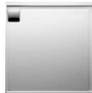
Duschtasse - FA. Laufen 80x80