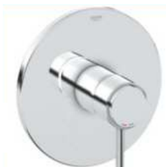
Dusche Armatur, Einhebelmischer Grohe